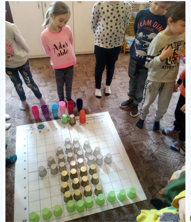
Działanie w oparciu o instrukcje - dzieci mają za zadanie ułożyć kubki w odpowiedni sposób